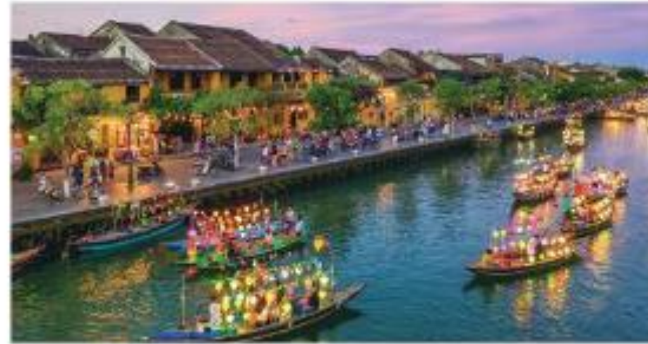
Hình 6. Du lịch trên sông Hoài ở Hội An

Hội An với nhiều sản phẩm du lịch độc đáo như "Đêm phố cổ", "Lễ hội đèn lồng",... kết hợp các hoạt động văn hoá truyền thống khác nên đã thu hút đông đảo lượng du khách trong nước và quốc tế đến tham quan.