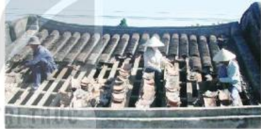
Hình 7. Trùng tu nhà cổ ở Hội An